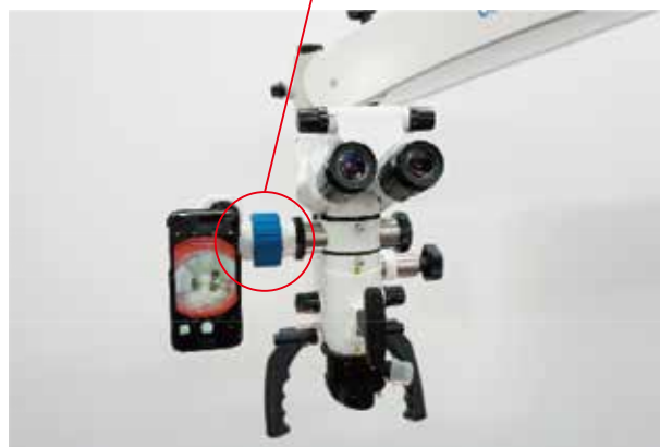
デジタルカメラアダプタ 2 「スマートフォン用 / Easy 360」装着イメージ