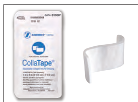
パッケージよりコラテープを取り出す。