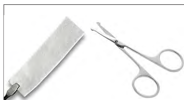
創傷面の大きさに合わせて切断。