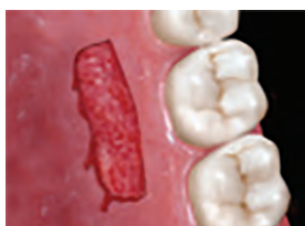
遊離歯肉移植術などでの口蓋側歯肉採取後の状態。